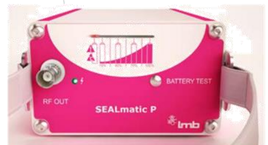
Nabití baterie < 10% - sváření není povoleno