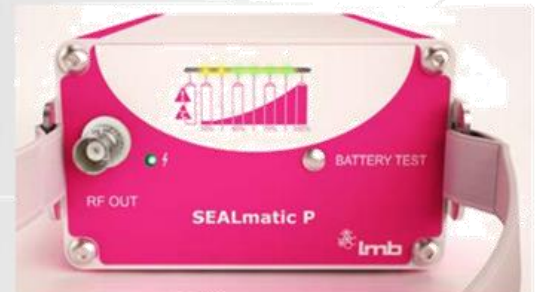
Svařovací proces: monitoring sváření