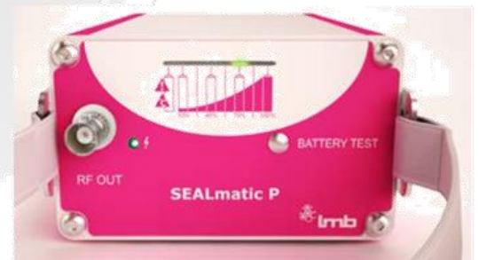
Baterie – stav nabití baterie